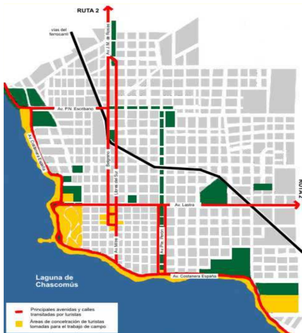
Plano I. Núcleos turísticos tomados como objeto de estudio. Principales avenidas y calles transitadas por turistas.

Como se especificara en puntos anteriores, los núcleos turísticos tomados como objeto de estudio fueron la laguna y el casco histórico de Chascomús (ver Plano I).